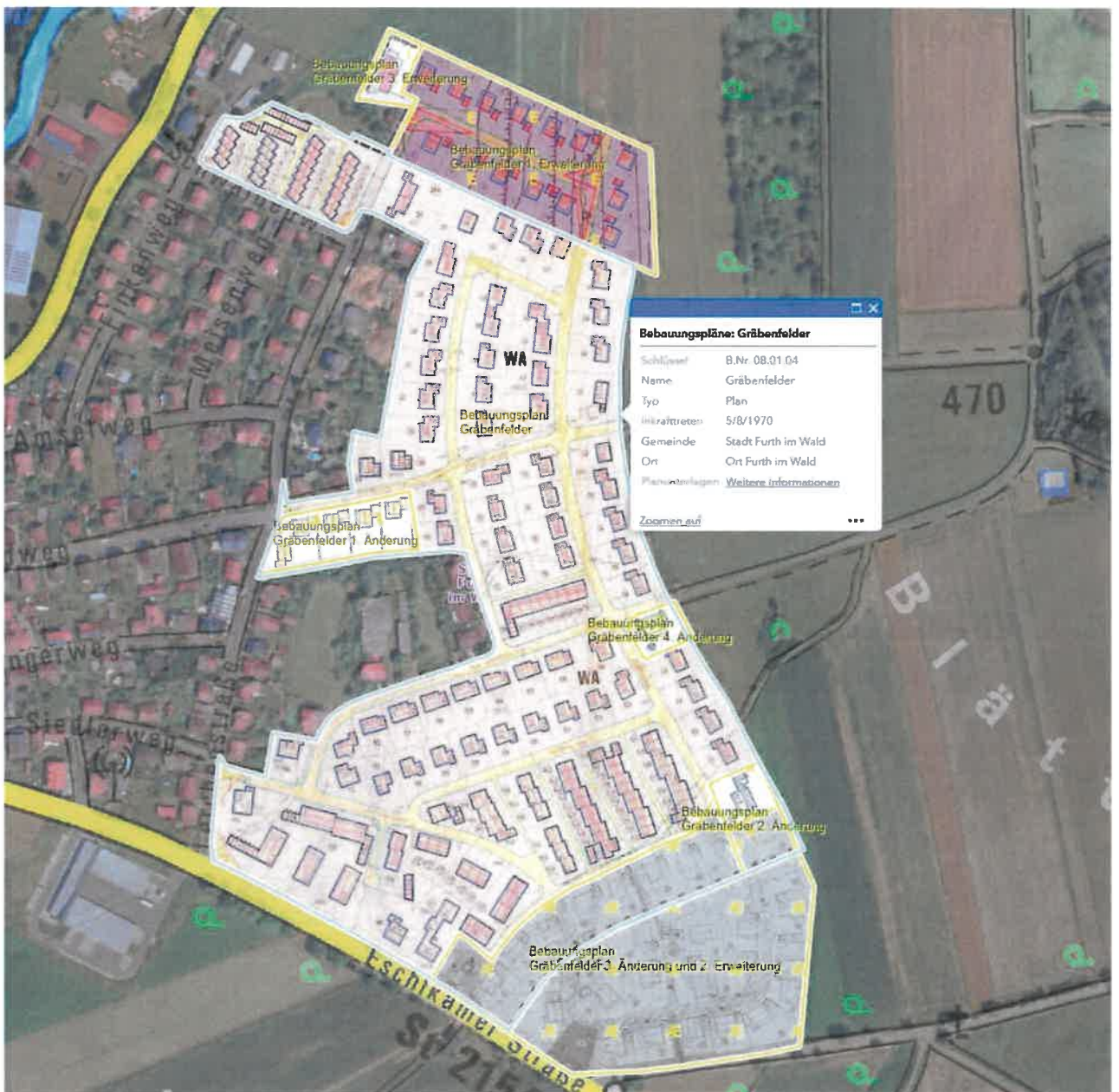
Bebauungsplan „Gräbenfelder“ B.Nr. 08.01.04 mit dessen 1. bis 4. Änderung und 1. bis 3. Erweiterung / ohne Maßstab