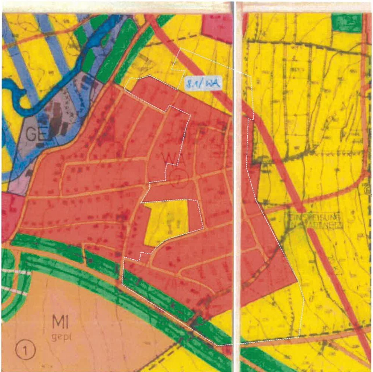
Ausschnitt aus dem gültigen Flächennutzungsplan F.Nr. 08 der Stadt Furth im Wald / ohne Maßstab

Im rechtskräftigen Flächennutzungsplan F.Nr. 08 und dessen 1. Änderung F.Nr. 08.01 ist der Bereich des Bebauungsplans als Wohnbaufläche dargestellt.