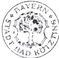
Markus Hofmann Erster Bürgermeister