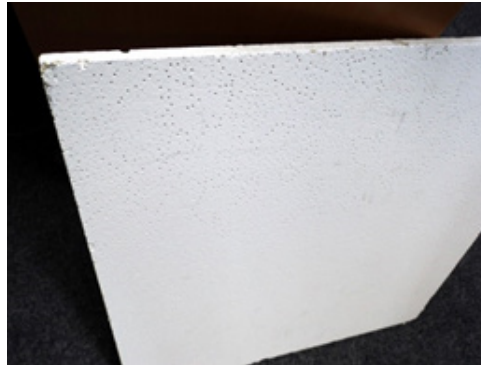
Platten im ausgebauten Zustand

Der Rückbau dieser Deckenplatten soll zerstörungsfrei erfolgen. Die Platten müssen in speziellen Sammelsäcken gestapelt verpackt und auf gesonderten Paletten zur Entsorgung bereitgestellt werden. Das Verpackungsmaterial, Säcke und Paletten, ist über die Kreiswerke Cham erhältlich. Auf der Rückseite dieses Merkblattes sind die Maximalabmessungen der gepackten Platten abgebildet.