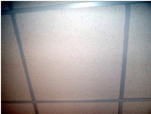
Platten im eingebauten Zustand

Künstliche Mineralfaser-Verbundplatten, besser bekannt als Odenwaldplatten, finden hauptsächlich Verwendung in abgehängten Deckensystemen. Diese Platten bestehen aus künstlichen Mineralfasern (KMF) und organischen Füllstoffen wie z.B. Ton oder Perlit, die mit Bindemitteln zu einer rechteckigen Form verpresst wurden.