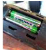
Mobiltelefon (Bat- terien entfernen!)