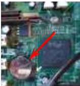
Pufferbat. in PC

Sind die Batterien fest im Gerät verbaut (z.B. Stütz- oder Pufferbatterie im Computer, TV-Receiver oder Batterie in elektrischer Zahnbürste, ...) so können diese „Geräte mit Batterie“ zusammen mit anderem Elektroschrott auf den Wertstoffhöfen im Landkreis Cham regulär entsorgt werden.