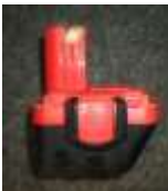
Steckakku (aus Akkuschauber)

Sind die Batterien so im/am Gerät verbaut, dass diese problemlos entfernt oder getauscht werden können (regelmäßiger Batterietausch im Normalbetrieb notwendig) so müssen die Batterien vor der Abgabe des Elektrogerätes vom Letztnutzer entfernt und getrennt vom Elektroaltgerät in die Altbatteriesammlung gegeben werden.