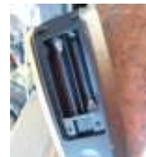
Fernbedienung (so entsorgbar)

Eine Sicherung des Batteriefachdeckels z.B. mit einer Schraube (oft bei Kinderspielzeug) gilt auch als „problemlos tauschbar / entfernbar“.