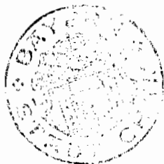
Bucher Erste Bürgermeisterin