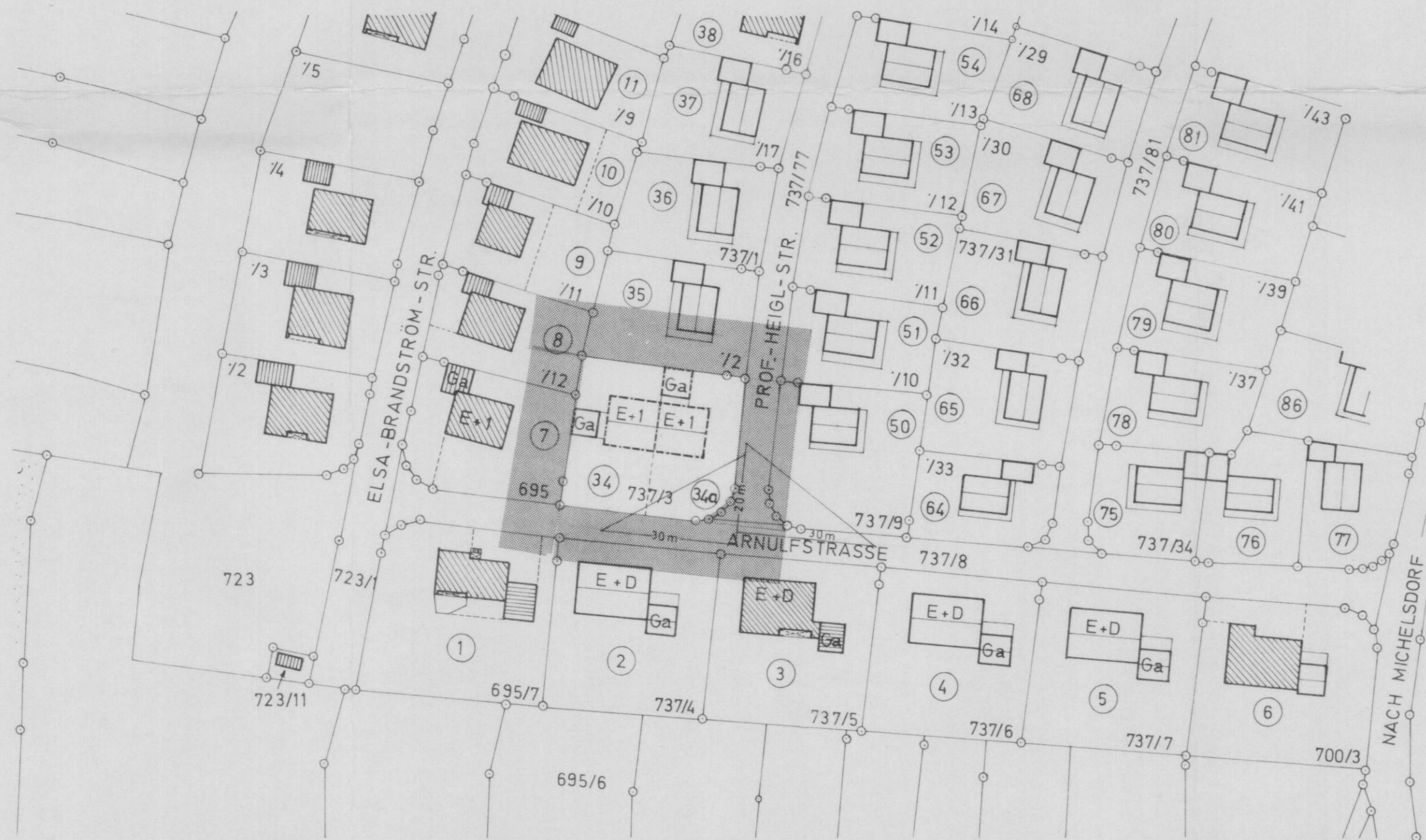
LAGEPLAN M = 1 : 1000