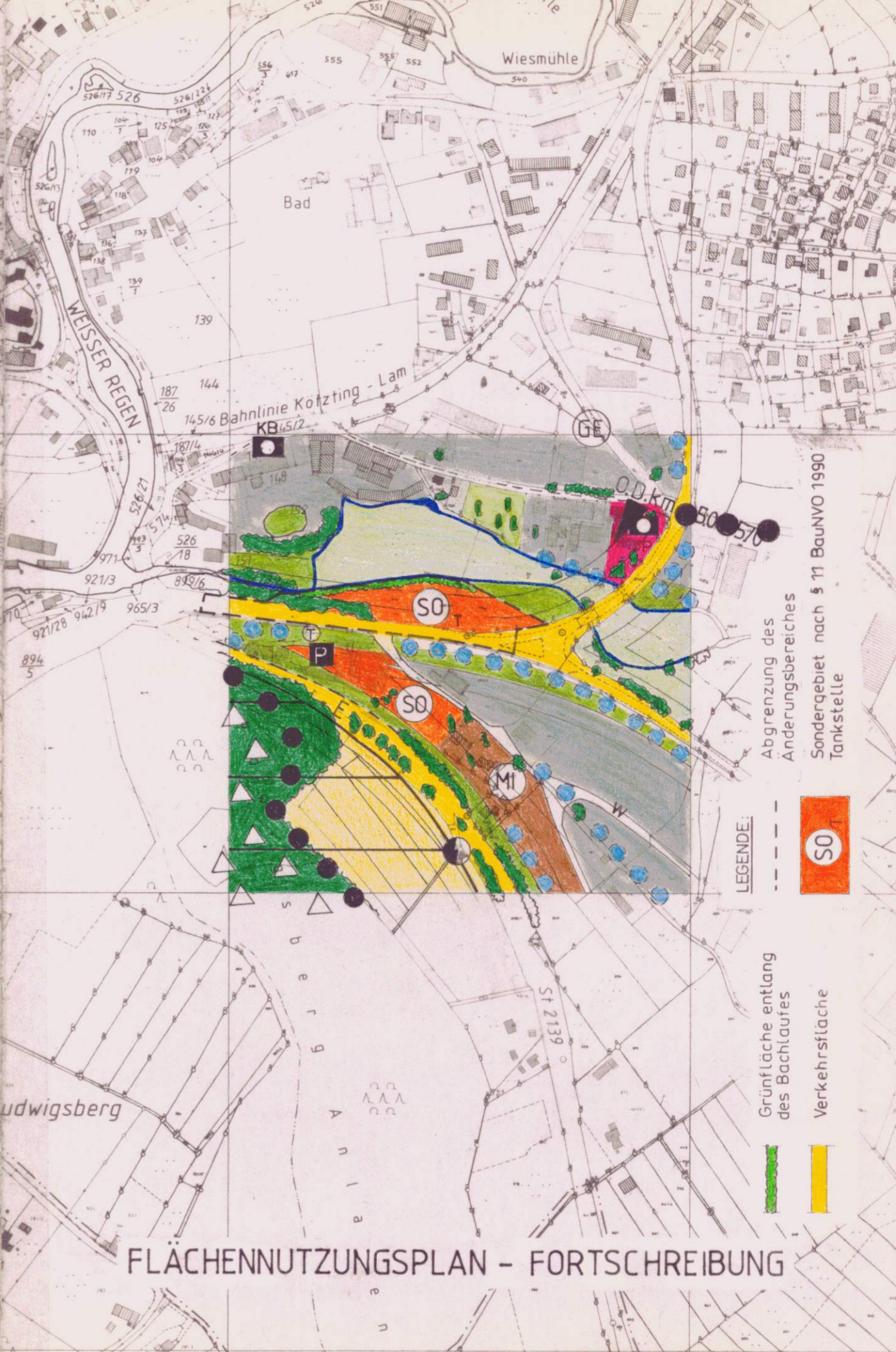
FLÄCHENNUTZUNGSPLAN - FORTSCHREIBUNG